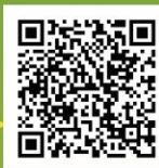
農業打工計畫生活圈