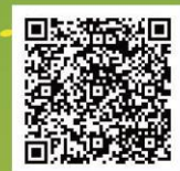
農業打工計畫要點