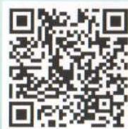
經濟部智慧財產局廣告